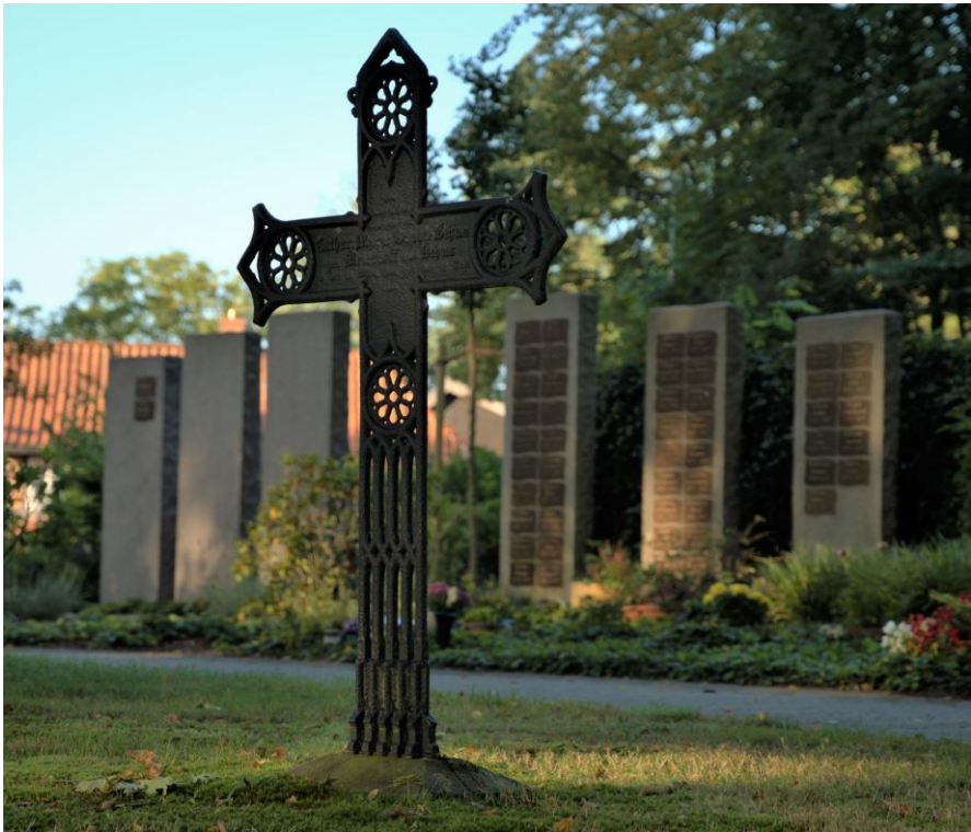
Historisches Kreuz auf unserem Friedhof – Foto: G.Cohrs

„Ich will das Verlorene wieder suchen und das Verirrte zurückbringen und das Verwundete verbinden und das Schwache stärken.“ Ezechiel 34,16 – Monatsspruch November